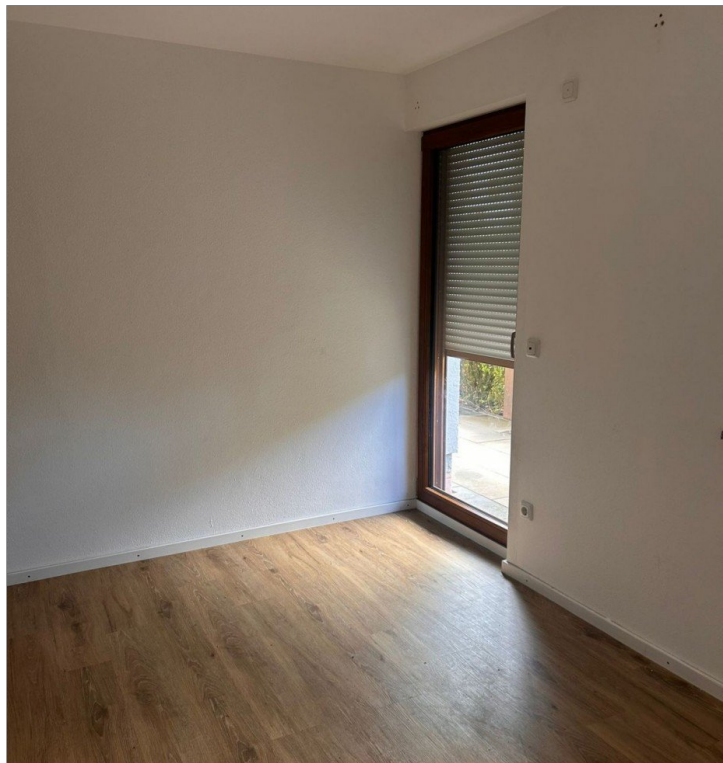
WhatsApp Image 2026 06 15 at 08.28.24 (1)