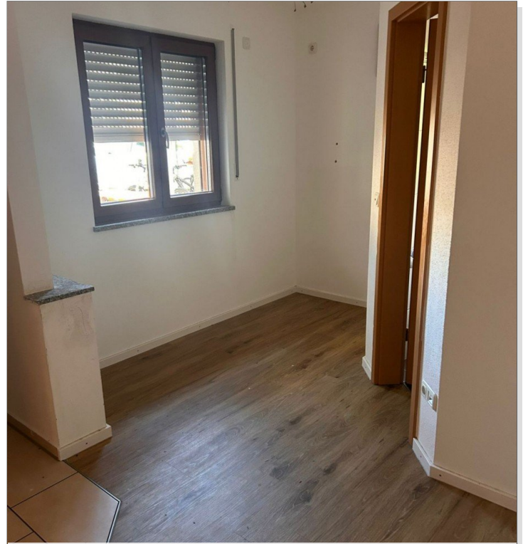
WhatsApp Image 2026 06 15 at 08.28.23 (4)