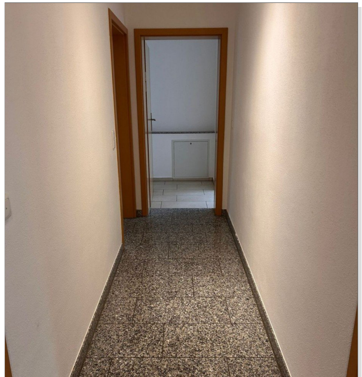
WhatsApp Image 2026 06 15 at 08.28.23 (1)