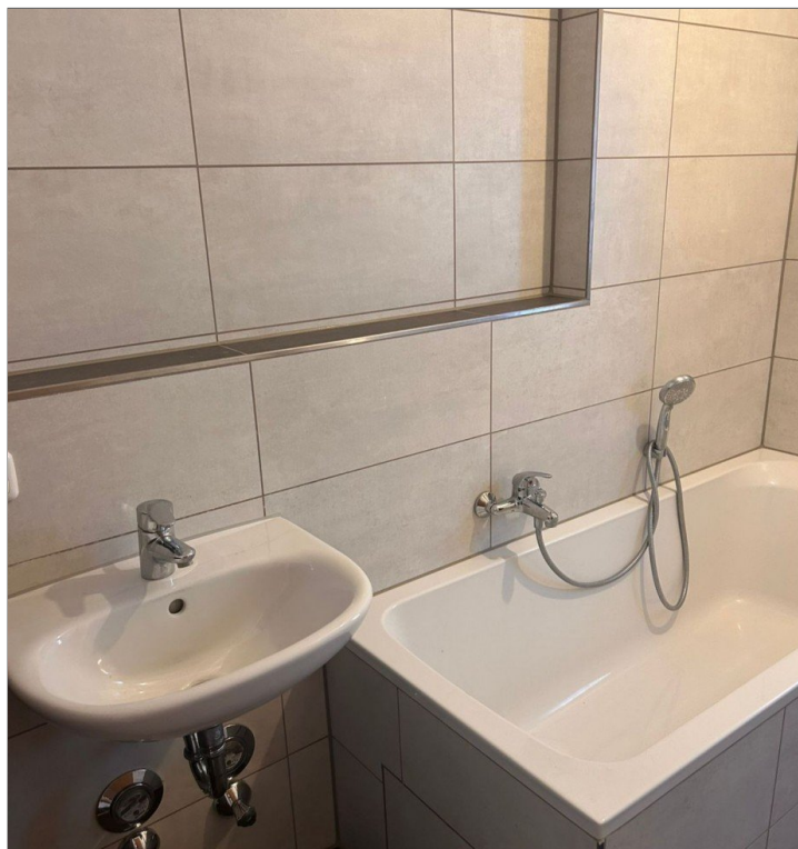
WhatsApp Image 2026 06 15 at 08.28.24 (4)