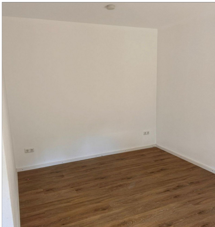
WhatsApp Image 2026 06 15 at 08.28.24 (2)