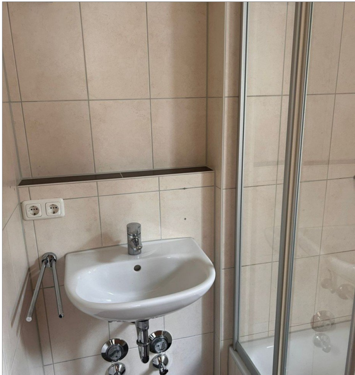
WhatsApp Image 2026 06 15 at 08.28.24 (9)