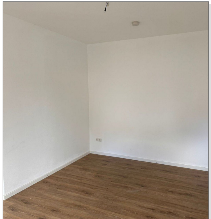
WhatsApp Image 2026 06 15 at 08.28.23 (5)