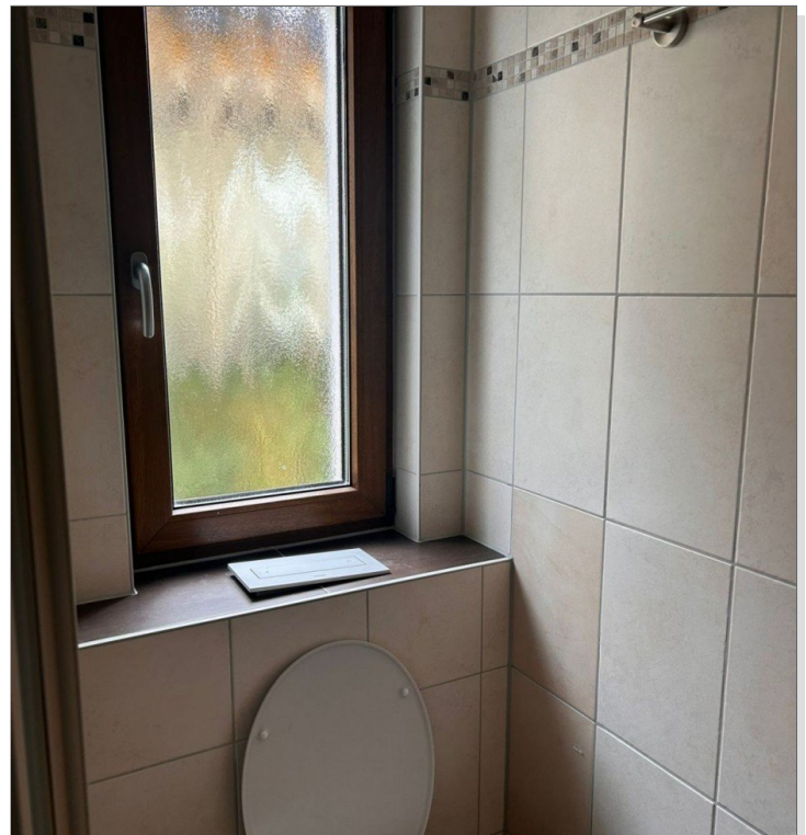
WhatsApp Image 2026 06 15 at 08.28.24 (8)