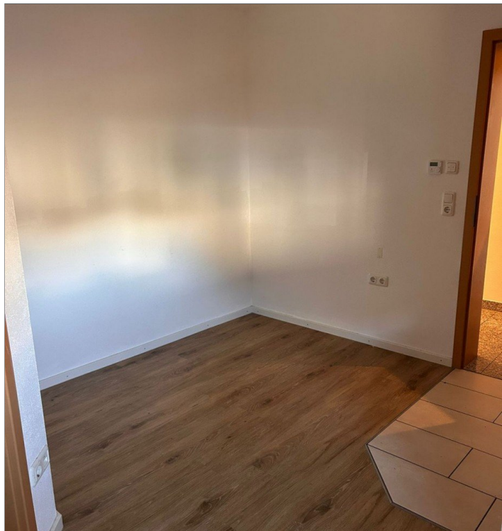
WhatsApp Image 2026 06 15 at 08.28.23 (3)