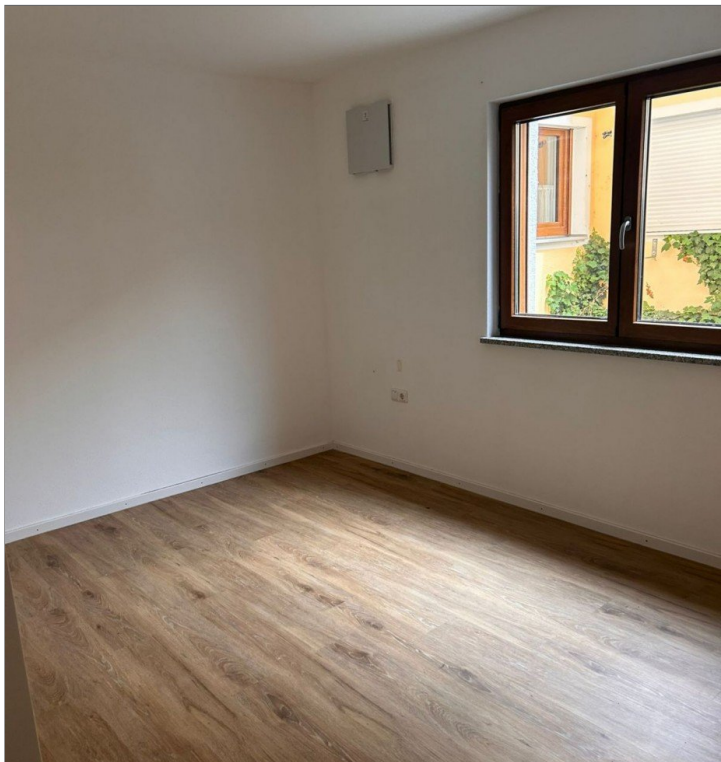
WhatsApp Image 2026 06 15 at 08.28.24 (6)