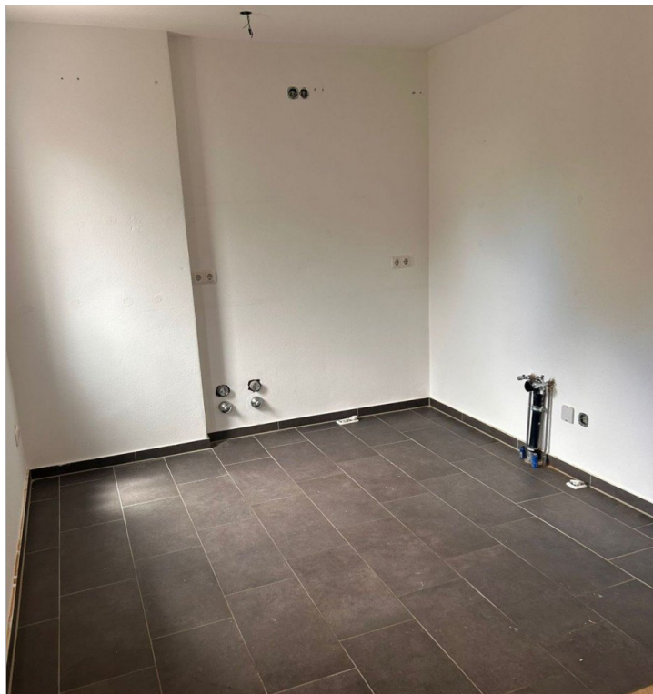
WhatsApp Image 2026 06 15 at 08.28.24 (3)