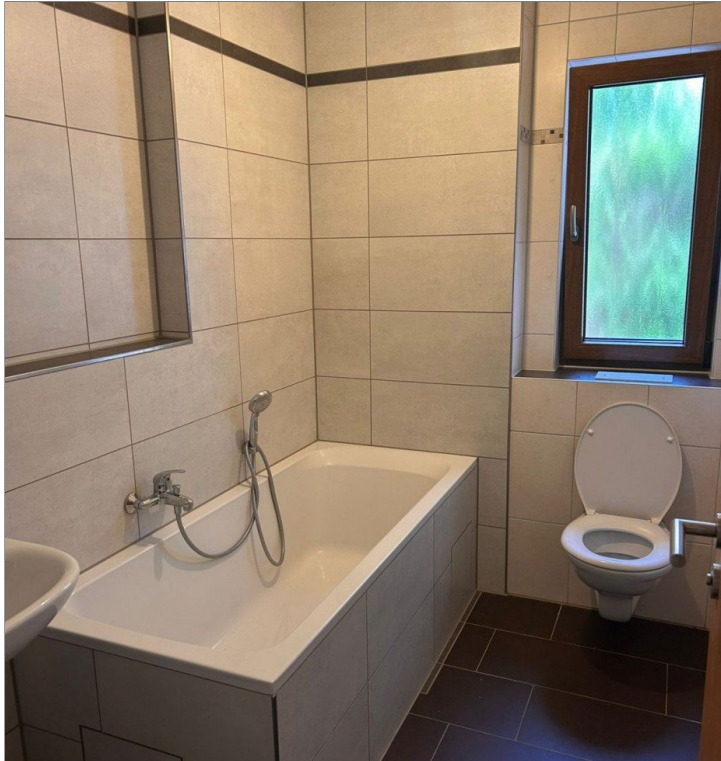
WhatsApp Image 2026 06 15 at 08.28.24 (5)