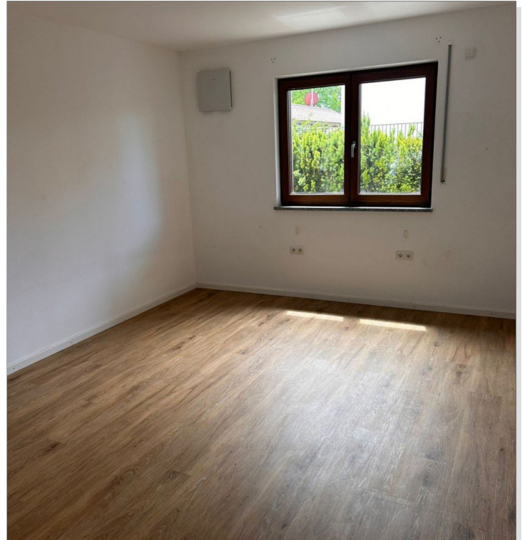
WhatsApp Image 2026 06 15 at 08.28.24 (7)