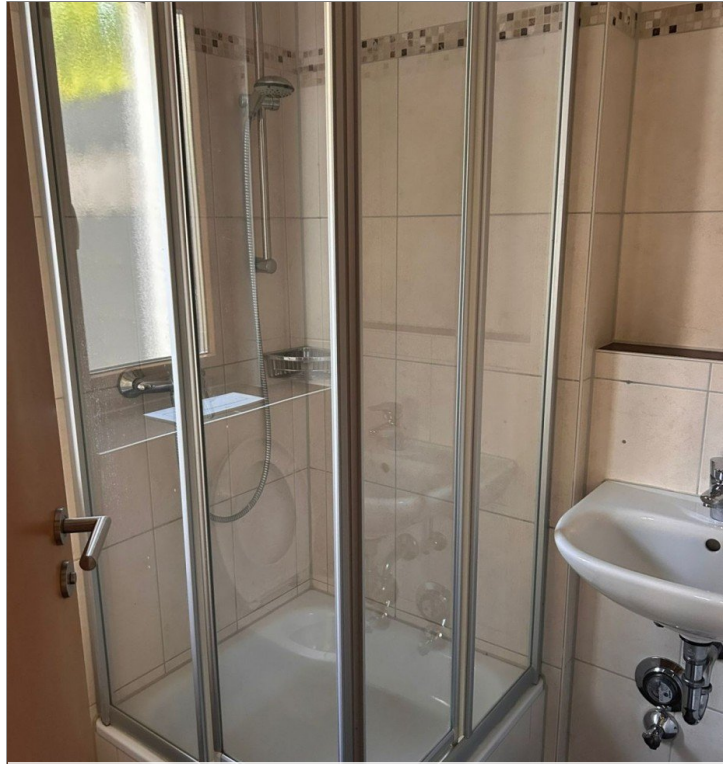
WhatsApp Image 2026 06 15 at 08.28.23 (2)